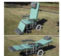
フルリクライニング車いす ストレッチャーとしても利用可能