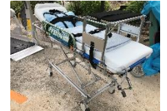
昇降式ストレッチャー 背部ギャッジアップ可能 上部を取り外し担架として利用可能。(バックラック有)