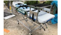
昇降式ストレッチャー