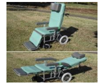
フルリクライニング車いす